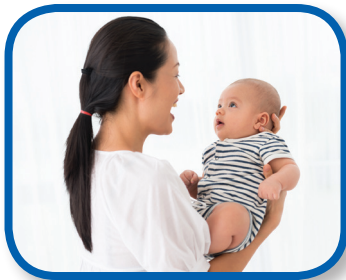
Estar completamente presente De 0 a 12 meses