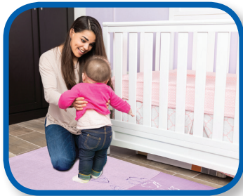
Transiciones sin problemas De 3 a 12 meses