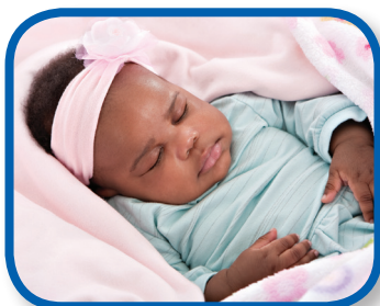
Buenas noches, bebé De 9 a 12 meses