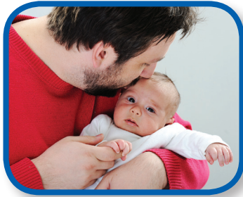
Te conozco De 0 a 3 meses